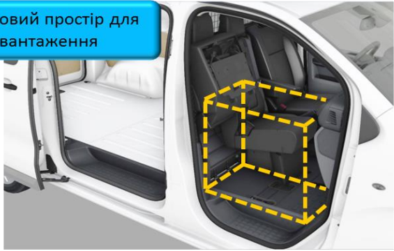
Додатковий простір для завантаження